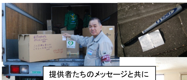
提供者たちのメッセージと共に